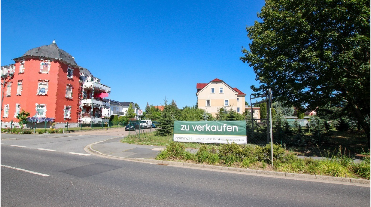
Blick Richtung Tannenstraße