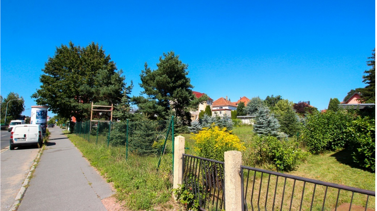
Blick Richtung Dresdner Straße